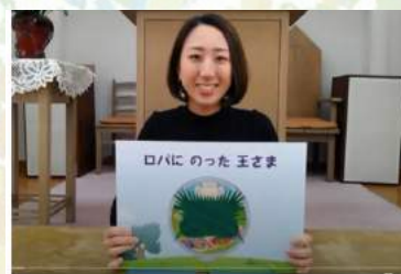
聖書のお話とメッセージ