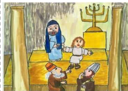
イラスト：池上佐和さん

(ちいろばタイムー教会学校が終わってからの楽しみー)では、先月から始めた「紙カゴ作り」を進めていきます!!前回の続きですが、前回お休みした人や初めての友達も参加できますので、みんなで素敵な紙カゴを編んでみませんか??4月のイースターの時に、もらう卵を入れて持って帰ります。