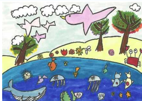
イラスト:池上佐和さん

その家族をくださった神様に感謝し、家族の愛に感謝し、うれしい気持ちを周りの人と分かち合いましょ。そして神の家族である教会での生活を大切にしていましょ。