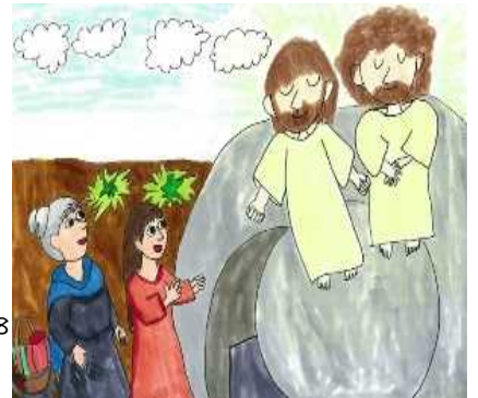
イラスト 池上佐和さん

24日(日) 「罪びとの救いのために御子を十字架につけた神様の愛」ローマの信徒への手紙5:8